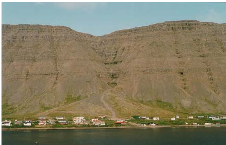
Mynd 7: Aurkeilan neðan Gilsbakkagils (ljósmynd: Jón Gunnar Egilsson, 1992). Takið eftir að aurkeilan er alsett vatns- og skriðrásur.