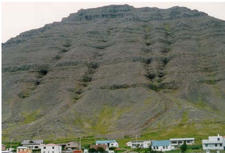
Mynd 6: Setmyndanir fyrir neðan „Milligilin“ (ljósmynd: Jón Gunnar Egilsson, 1992).

beggja vegna „Milligiljanna“ ber þess merki að aurskriður hafa fallið þar og eru vatns- og skriðufarvegir áberandi.