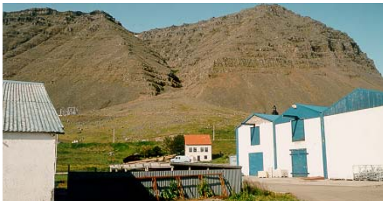
Mynd 5: Aurkeilan neðan Búðargils. Takið eftir því hversu slétt yfirborð aurkeilunnar er.