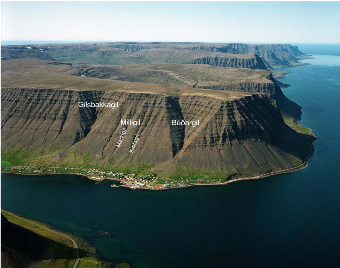
Mynd 2: Bíldudalur. Helstu örnefni.