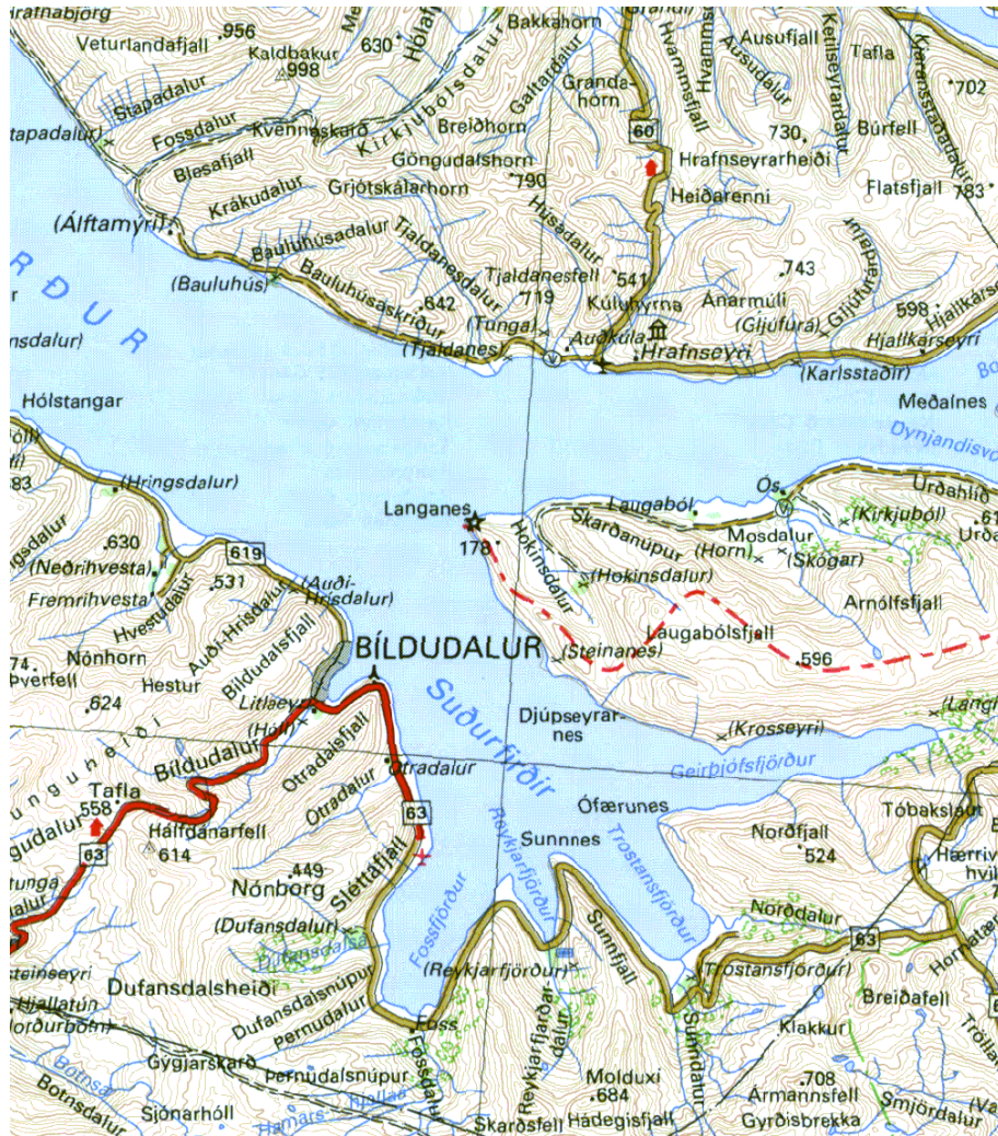
Mynd 1: Yfirlitskort af nágrenni Bíldudals.